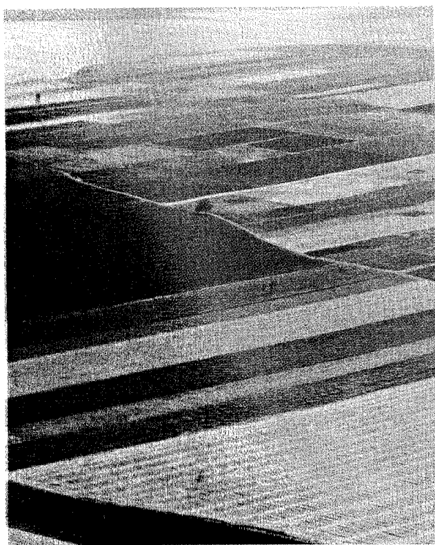
Ravnica uz obalu